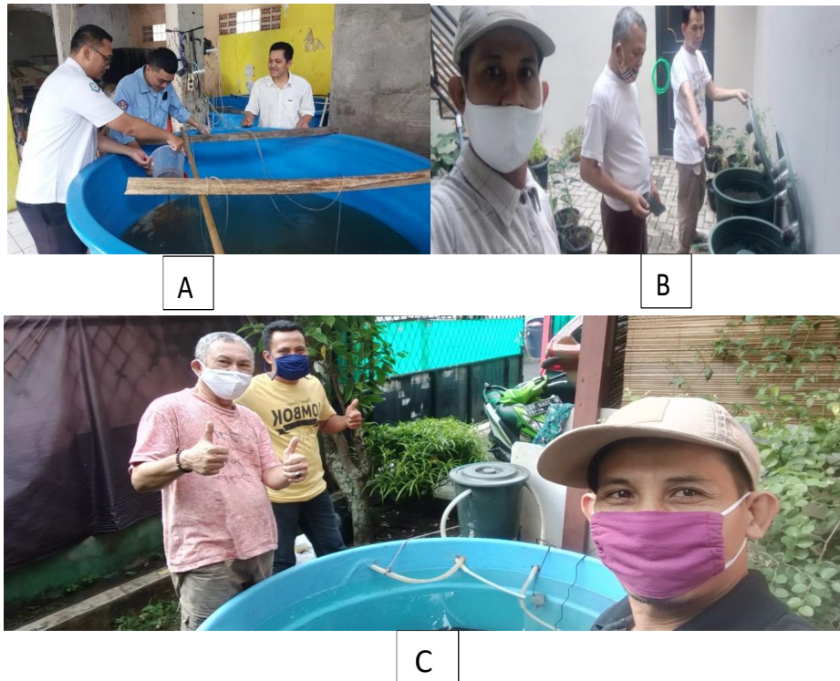
Gambar 2. A. Identifikasi permasalahan B ; Pengenalan sistem budidaya ikan dalam ember C ; Pandampingan dan pemberian solusi

Provinsi pada tahun 2023. Pencapaian ini menunjukkan bahwa kelompok memiliki potensi besar untuk terus berkembang apabila mendapat pendampingan dan pembinaan yang tepat dan berkelanjutan.