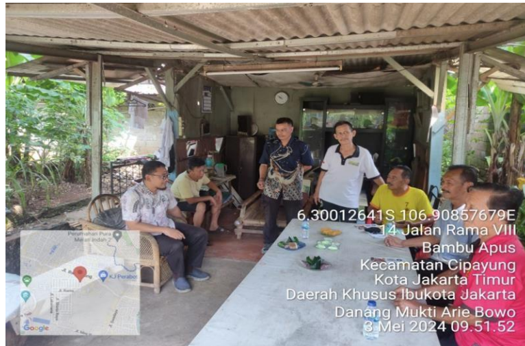
Gambar 6. Kegiatan FGD Pokdakan Mina Nusantara

aturan organisasi (AD/ART) serta menyepakati jadwal pertemuan rutin bulanan sebagai wadah koordinasi dan evaluasi usaha (Gambar 6). Pertemuan rutin yang selama ini sudah berjalan satu kali per bulan akan dioptimalkan sebagai forum evaluasi pelaksanaan rencana usaha bersama. Keberadaan aturan yang jelas dan disepakati bersama oleh seluruh anggota kelompok merupakan prasyarat bagi kelompok yang sehat dan produktif (Mardikanto, 2017).