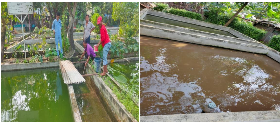
Gambar 4. Fasilitas Kolam Pokdakan Mina Nusantara

Kegiatan penyuluhan penguatan kelembagaan dilaksanakan dalam forum pertemuan kelompok. Materi yang disampaikan mencakup pentingnya kesamaan visi dan misi dalam organisasi, prinsip tata kelola kelompok yang baik, serta peran dan fungsi pengurus dalam mengelola organisasi. Dalam sesi ini, anggota kelompok diajak untuk merumuskan kembali visi dan misi bersama kelompok, yaitu membangun masyarakat yang mampu melakukan kegiatan pembudidayaan ikan dengan memanfaatkan sumber daya alam dan teknologi yang berkembang, serta misi untuk memajukan dan