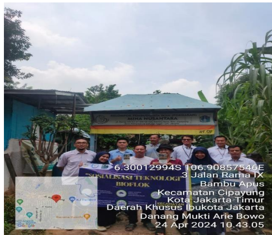
Gambar 3. Kegiatan Workshop Teknologi Bioflok dan Penyusunan Rencana Usaha Pokdakan Mina Nusantara

kelembagaan dan kesamaan tujuan antaranggota (Hermanto dan Swastika, 2011). Adapun solusi dan bentuk kegiatan yang ditawarkan sebagai solusi dari permasalahan yang dihadapi pokdakan terlihat pada Tabel 1.