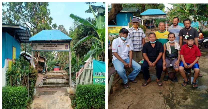
Gambar 2. Pertemuan Rutin Anggota Pokdakan Mina Nusantara berlokasi di Kelurahan Bambu Apus, Kecamatan Cipayung, Jakarta Timur

Metode yang digunakan adalah pendekatan Participatory Rural Appraisal (PRA) atau pendekatan partisipatif dalam pemberdayaan masyarakat yang memungkinkan masyarakat Bersama-sama menganalisis masalah dan merumuskan perencanaan secara mandiri (Trapsila, 2018). Metode PRA diterapkan melalui tiga tahapan yaitu: (1) Penyuluhan penguatan kelembagaan: menggunakan metode ceramah interaktif dan re-orientasi visi-misi organisasi; (2) Pendampingan penyusunan rencana usaha ( Business